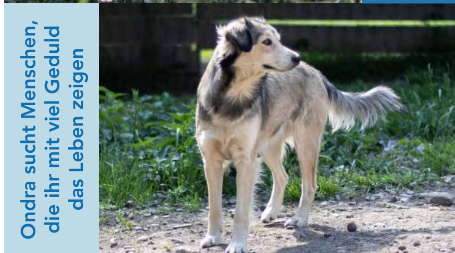
Ondra sucht Menschen, die ihr mit viel Geduld das Leben zeigen