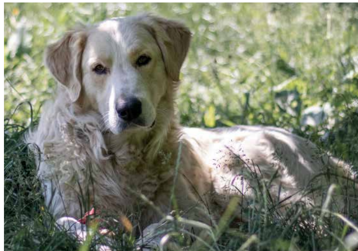
Unser großer Kuschelbär Isaac sucht noch nach seinen Menschen

uns etwas ganz besonderes. Da war zum Beispiel dieses Jahr Avicii, der sein Glück endlich gefunden hat. Oder Henry und Vita die endlich umziehen durften. Wir freuen uns so sehr für euch. Leider hatten nicht alle so viel Glück. So wartet unser großer Kuschelbär Isaac immer noch auf seine Menschen, die wissen wie sie mit einem Herdenschutzhund umgehen müssen und ihm ein artgerechtes Zuhause schenken können. Zudem hat Isaac eine kaputte Hüfte, so dass für ihn nur ein ebenerdiges Zuhause in Frage kommt. Unsere beiden Labrador Buben Carlos & Nero suchen ebenso noch nach einem Zuhause. Die Zwei sind so miteinander verbunden, dass für uns nur eine gemeinsame Vermittlung in Frage kommt. Unsere hübsche Ondra hab ich euch schonmal vorgestellt, bisher hat sich immer noch kein Zuhause für die schüchterne Maus ergeben. Dabei wäre das so wichtig, damit sie endlich das Leben kennenlernen kann. Auch viele weitere Fellnasen, wie Cato, Benji, Elliot, Finchen, Ally und Luna warten schon lange auf ihre Menschen. Ich und auch alle Zweibeiner