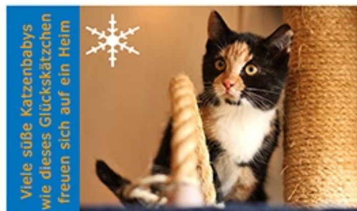
Viele süße Katzenbabys wie dieses Glückskätzchen freuen sich auf ein Heim

Auch die süße Marlies möchte sich herzlich bei ihrer lieben Pflegefamilie bedanken, wo sie sich von der dringend benötigten Hüft-Operation erholen durfte. Endlich kann die Hübsche sich ohne Schmerzen wie ein normaler Junghund austoben und nun fehlt ihr nur noch ein tolles Für-immer-Zuhause zu ihrem Glück!